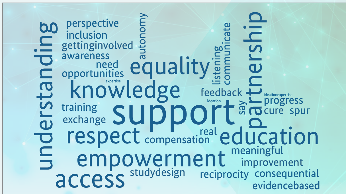
Abbildung 2: Wortwolke mit 45 Schlagwörtern, die von den Teilnehmenden während des ersten Teils des Online-Workshops im Dezember zum Thema „Vision“ zusammengetragen wurden (als Antwort auf die Frage: „Mit welchen Stichwörtern würden Sie Ihre persönliche Vision oder Ihre persönlichen Erwartungen bezüglich einer aktiven Patientenpartizipation in der Krebsforschung beschreiben?“)

In den folgenden Kapiteln – 1) Eine gemeinsame Vision, 2) Strategie, Umfang und Zeitpunkt der Partizipation, 3) Kommunikation, Verständnis und Beziehungen, 4) Ressourcen, Wissen und Kompetenzen, 5) Methoden und Ansätze und 6) Rechtliche und ethische Aspekte – werden die Prinzipien, die im Rahmen des Bottom-up-Prozesses aus den Diskussionen abgeleitet wurden, im Detail erläutert.